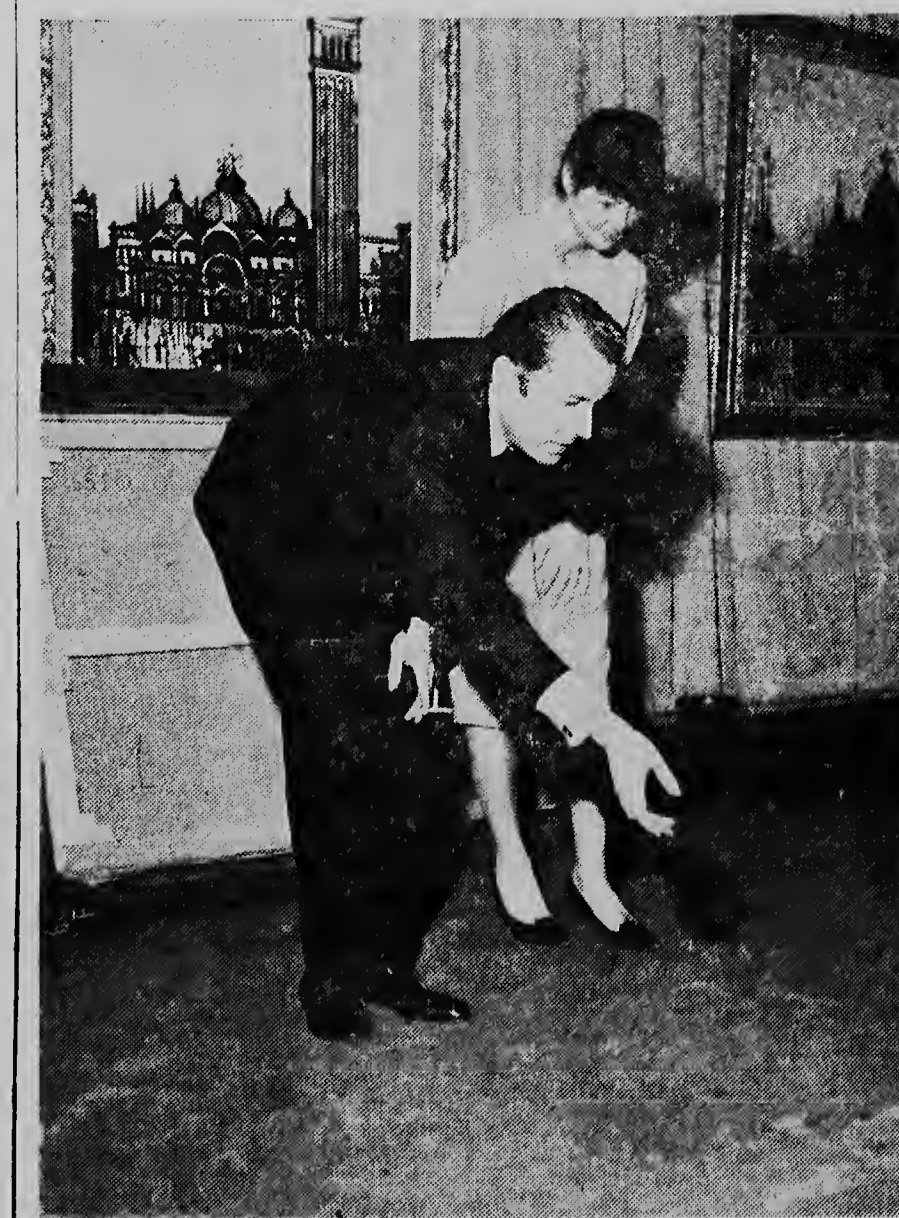
E pintor Franses Bernard Buffet, cu ta un di e mas famoso pintornan di Francia ta tene actualmente un exposicion na Paris. E portret ta mustra Buffet den presencia di su esposa, ex-modela Annabel, dilanti dos pintura di Venezuela for di anja 1962. Aki Buffet ta busca na unda el lo colga un di su pinturanan.